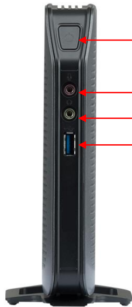
передняя панель терминальной станции